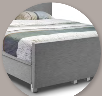
Boxspring 1927 met voetbord

Kijk voor ons volledige programma en dealeradressen op www.avek.nl .